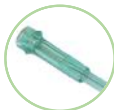
Connecteur ISO Standard